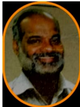
ചിത്രം - 2