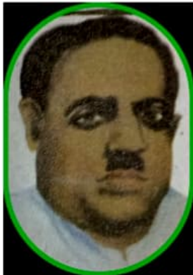
ചിത്രം - 1

വുമായി ബന്ധപ്പെട്ട ചിത്രം ഏതെന്ന് കണ്ടെത്തുക.