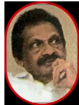
ചിത്രം - 3